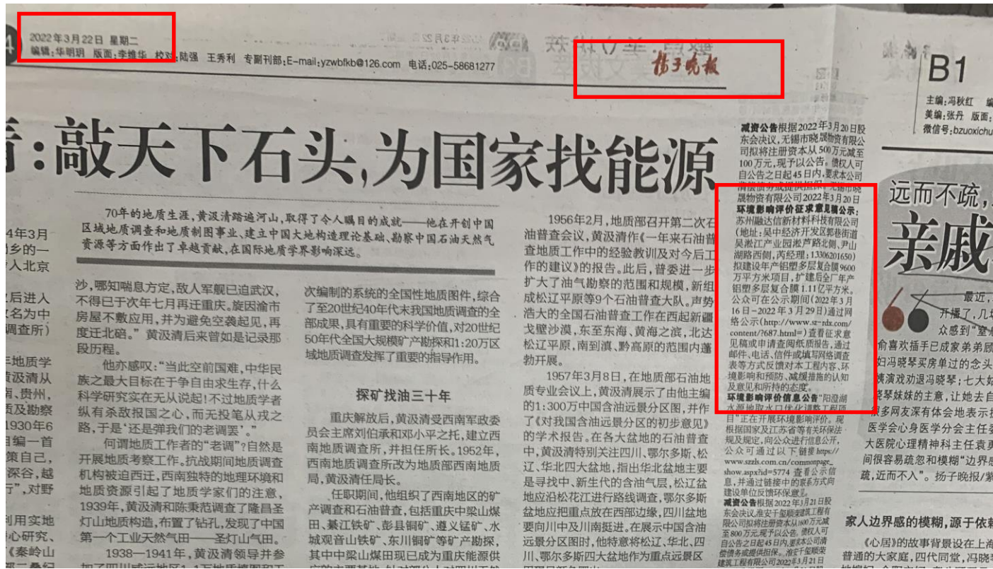
图 3.2-2 (1) 2022 年 3 月 22 日报纸公示照片

本项目的征求意见稿报纸公示是在扬子晚报上进行的，公示时间是 2022 年 3 月 22 日和 2022 年 3 月 23 日，报纸公示照片见图 3.2-2。